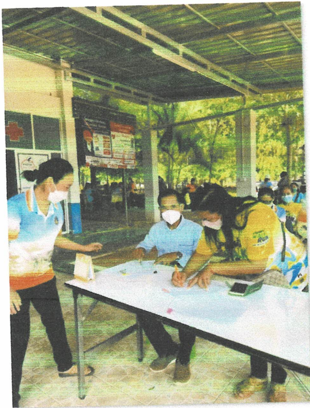
-กิจกรรมลงทะเบียน